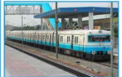
Bibinagar Railway Station