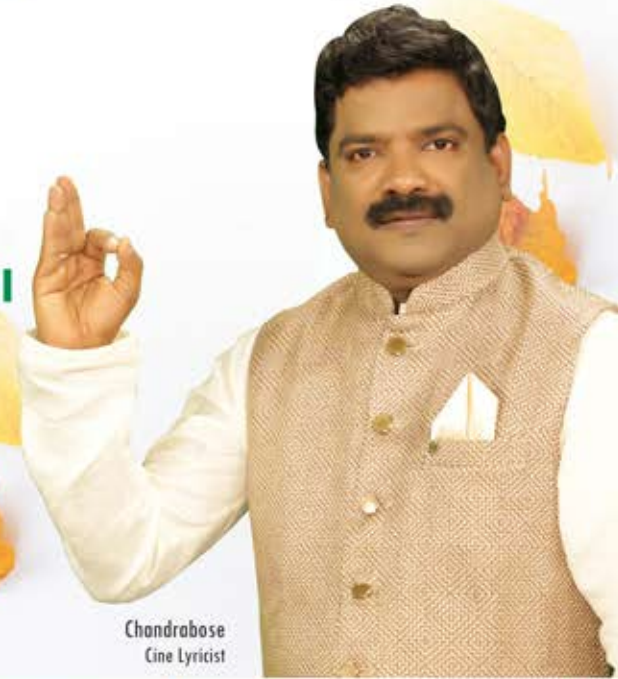
Chandrabose Cine Lyricist