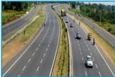
Warangal Highway Road